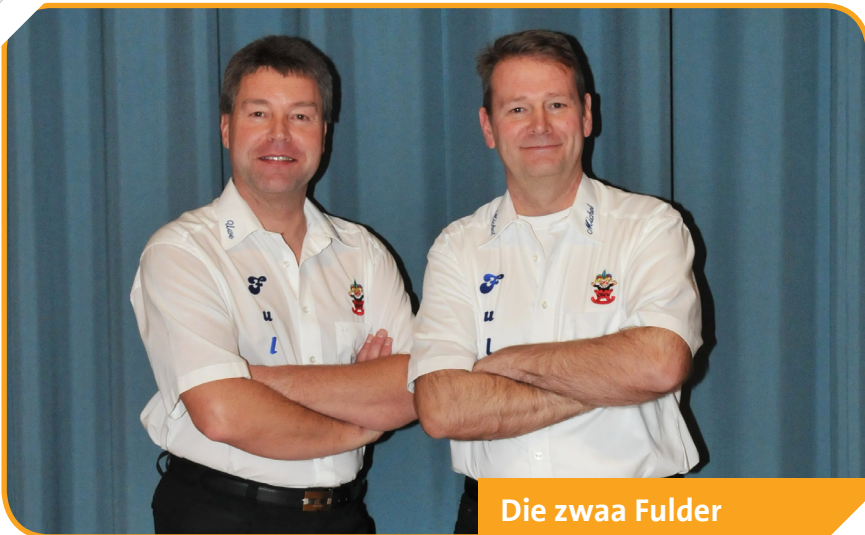
Die zwaa Fulder